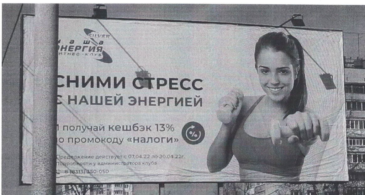
Фото № 2: Эскизное изображение рекламной конструкции, Сторона А.