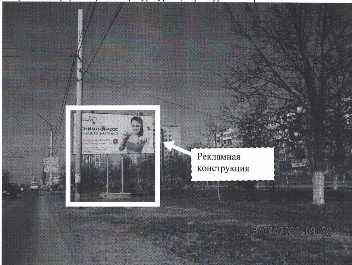
Фото № 1: Панорамное размещение рекламной конструкции.

Фотофиксация места установки (размещения) рекламной конструкции с эскизным изображением «Сторона А: Наша энергия Сними стресс С нашей энергией Получай кэшбэк 13% по промокоду "налоги" Сторона Б: Нас 450 особей что дальше? Нижегородская межрайонная природоохранная прокуратура Центр Амурский тигр»