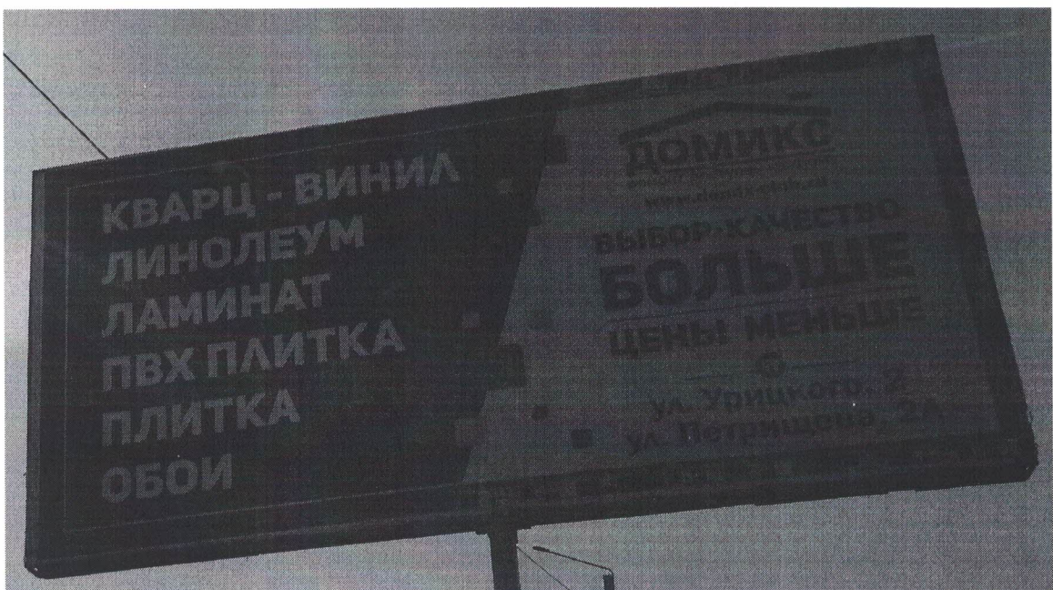
Фото № 2: Эскизное изображение рекламной конструкции, Сторона А.