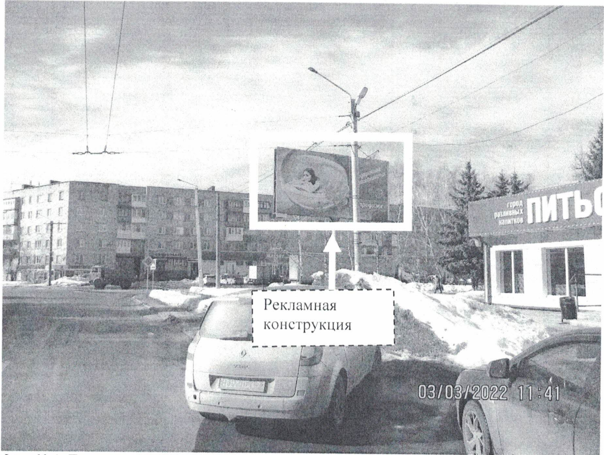
Фото № 1: Панорамное размещение рекламной конструкции.

Фотофиксация места установки (размещения) рекламной конструкции с эскизным изображением «Сторона А: Подарочные сертификаты в продаже Сторона Б: Женский клуб www.luxwellnes.ru Парковая аллея, д.6а +79503750705, (8313)244-144 Кедровая бочка»