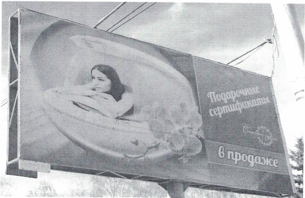
Фото № 2: Эскизное изображение рекламной конструкции, Сторона А.