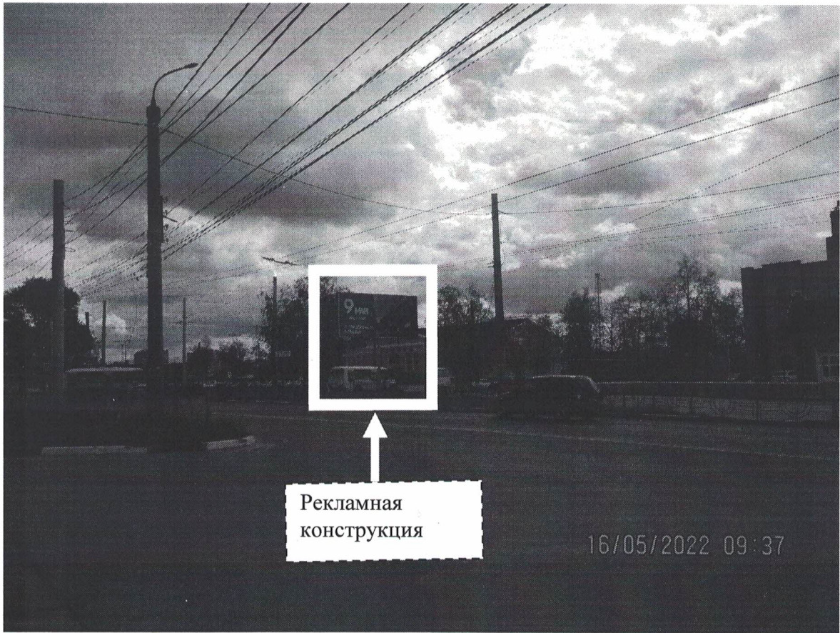
Фото № 1: Панорамное размещение рекламной конструкции.

Фотофиксация места установки (размещения) рекламной конструкции с эскизным изображением «Сторона А: 9 МАЯ 1941-1945 С ПРАЗДНИКОМ ПОБЕДЫ!; Сторона Б: Вечные остатки минут и ГБ не сгорают никогда. TELE2»