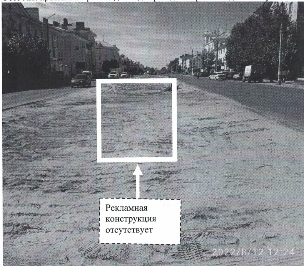
Фото №2: пр.Ленина в районе д.99 – после проведения работ по демонтажу.