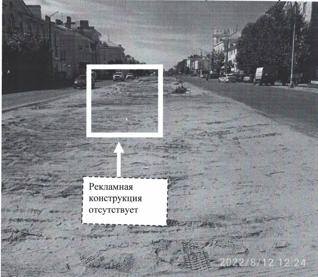
Фото №2: пр.Ленина в районе д.99 – после проведения работ по демонтажу.