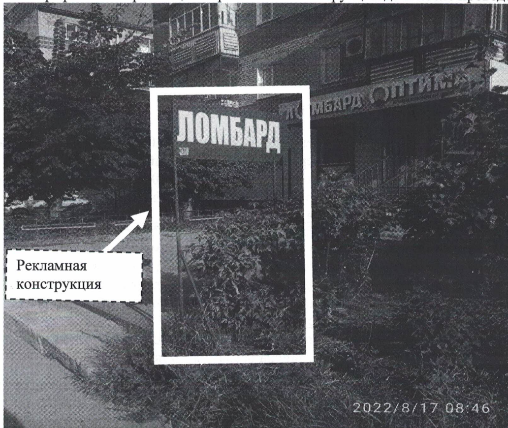
Фото №1: ул.Терешковой в районе д.4 – до проведения работ по демонтажу.