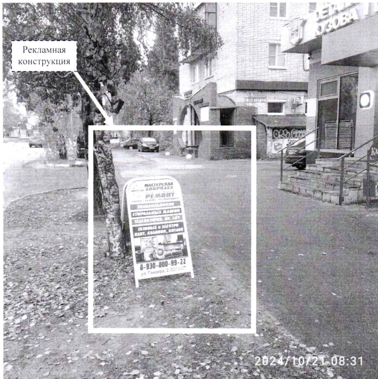
Фото № 1: ул. Гайдара, д. 4 – до проведения работ по демонтажу.

Фотографии места размещения рекламной конструкции до и после проведения работ: