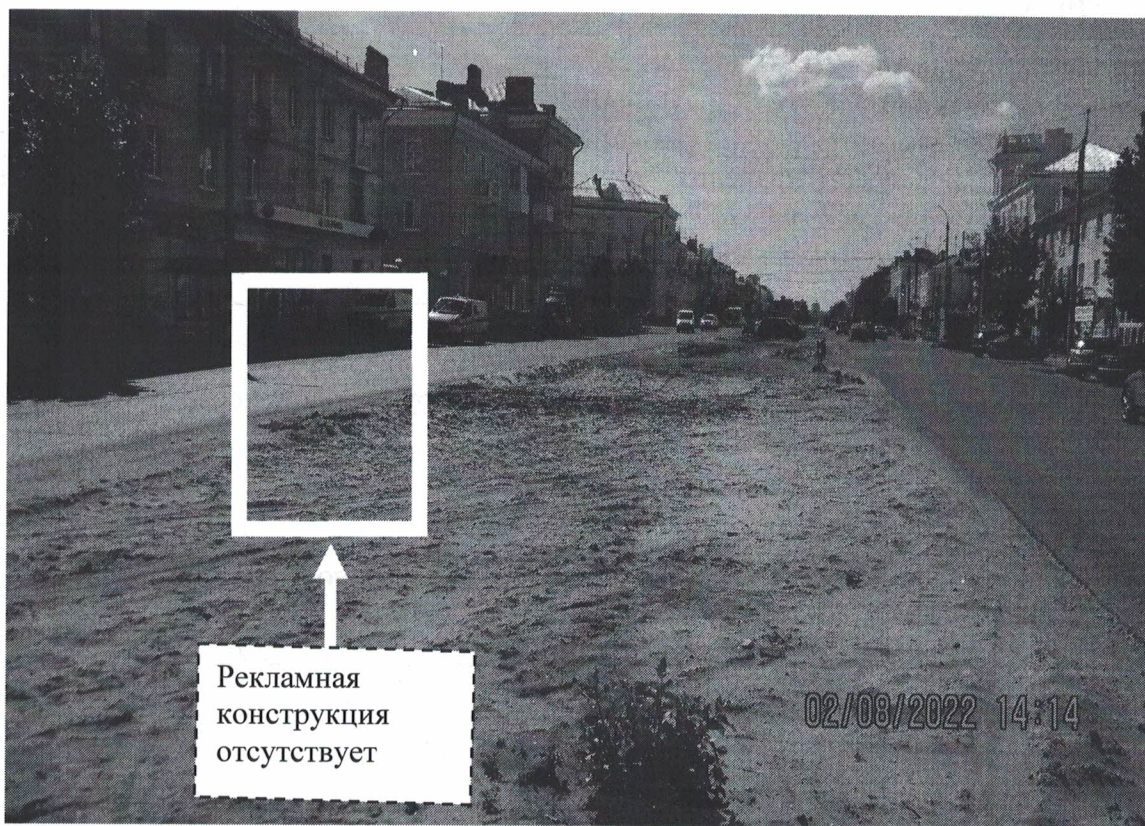
Фото №2: пр.Ленина в районе д.99 – после проведения работ по демонтажу.