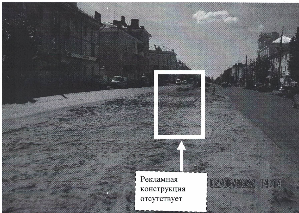
Фото №2: пр.Ленина в районе д.99 – после проведения работ по демонтажу.