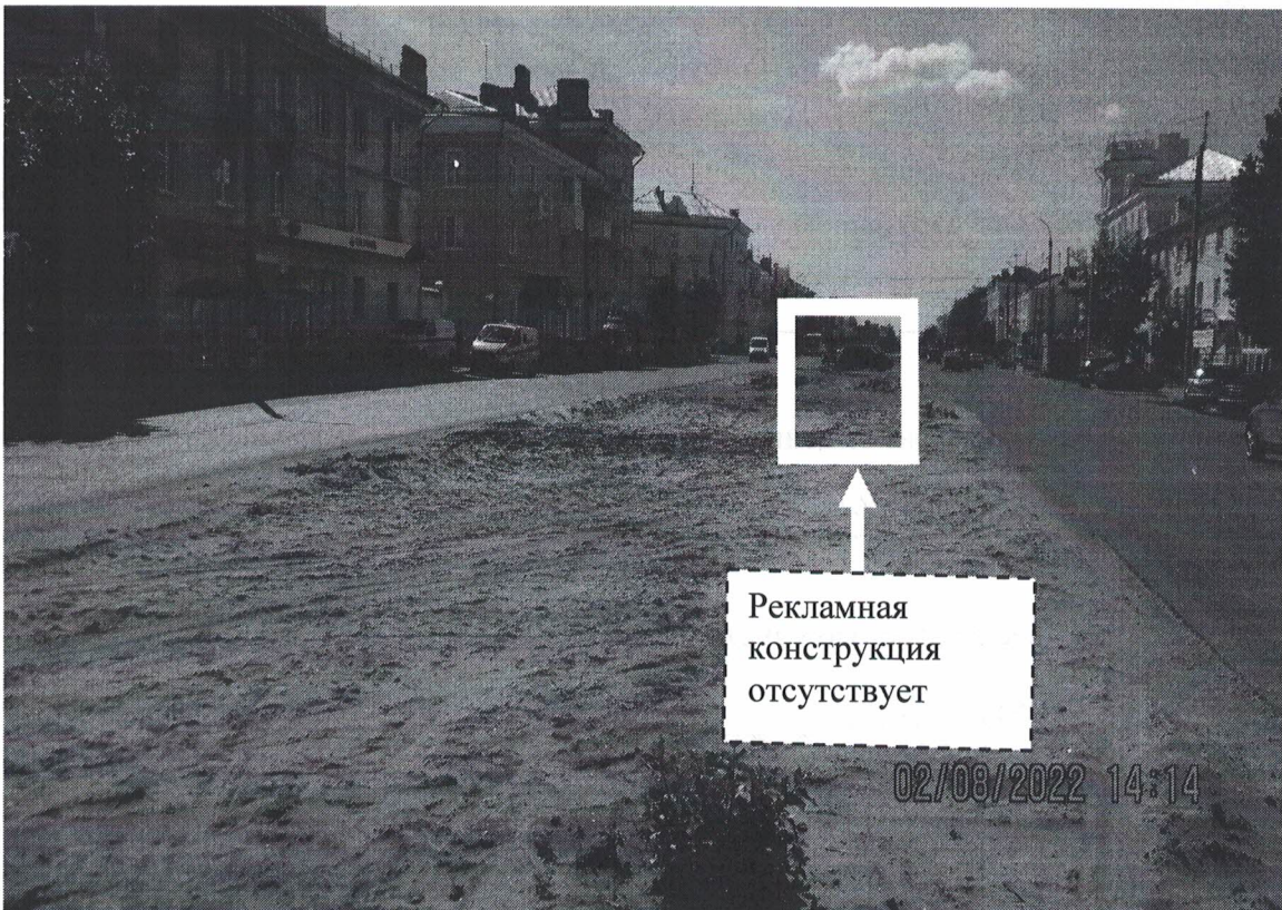
Фото №2: пр.Ленина в районе д.99 – после проведения работ по демонтажу.