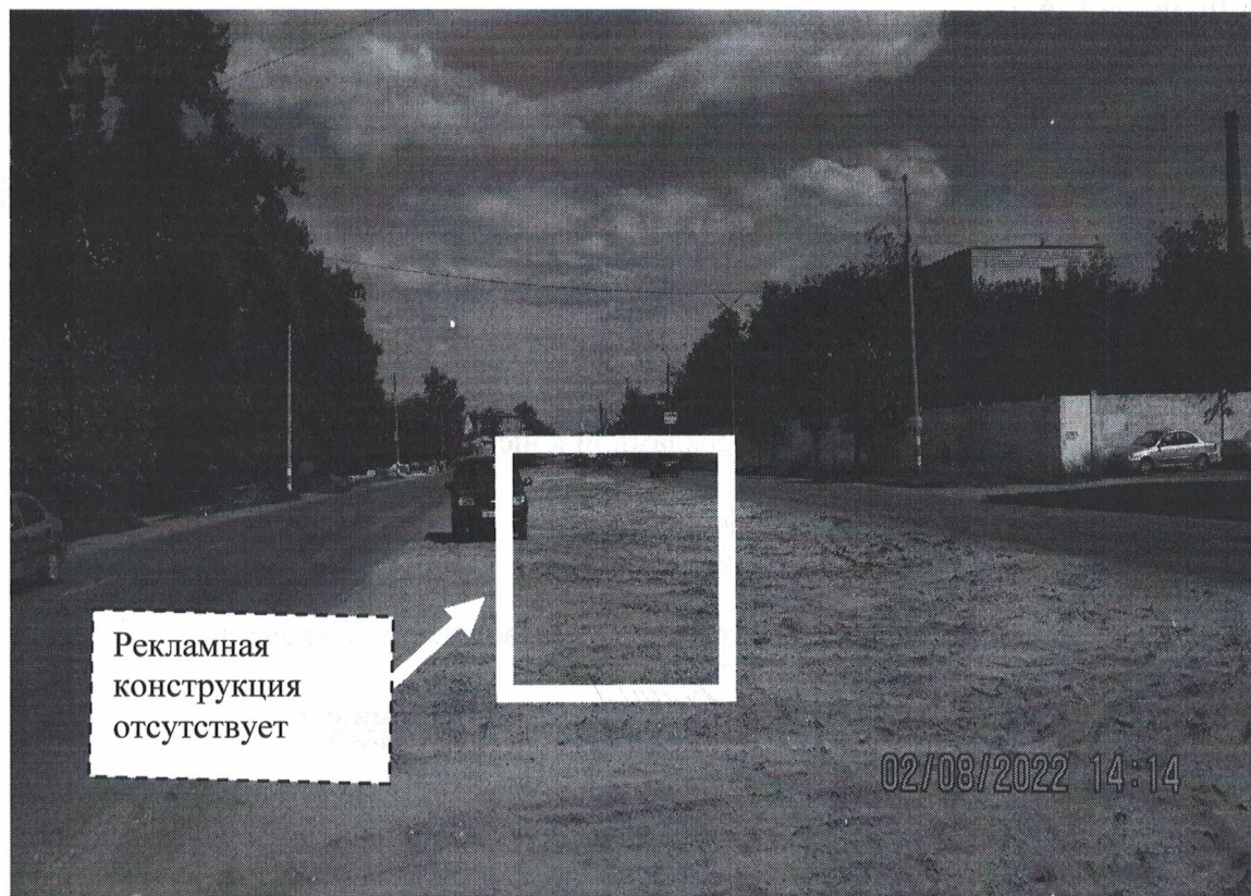
Фото №2: пр.Ленина в районе д.99 – после проведения работ по демонтажу.