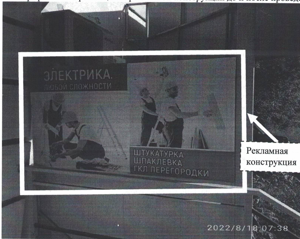
Фото №1: ул.Грибоедова д.6 – до проведения работ по демонтажу.