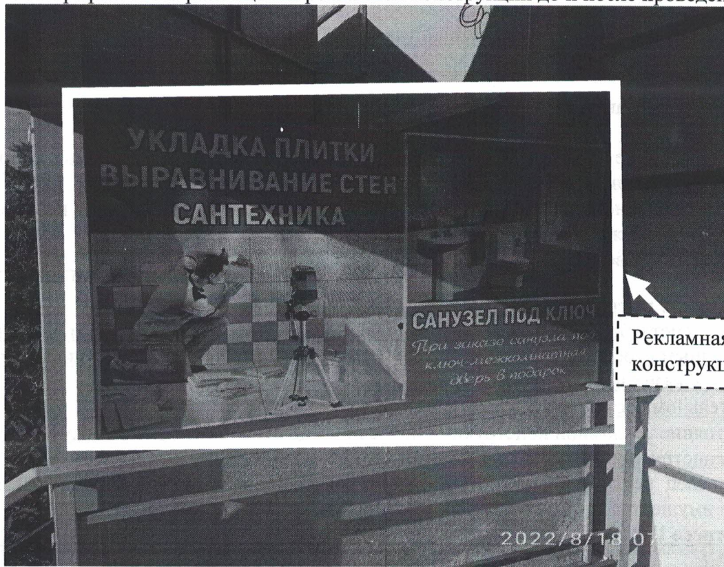
Фото №1: ул.Грибоедова д.6 – до проведения работ по демонтажу.

Фотографии места размещения рекламной конструкции до и после проведения работ