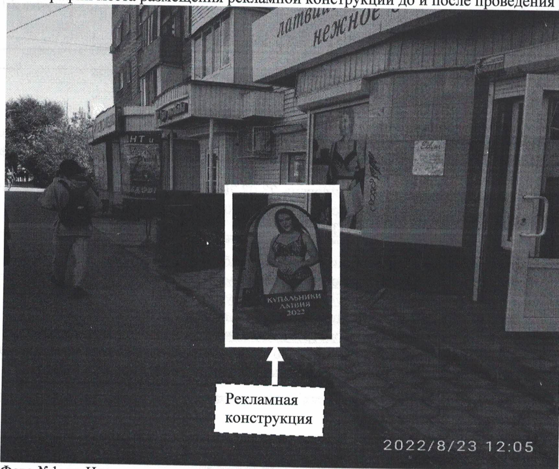
Фото №1: пр.Циолковского в районе д.19 – до проведения работ по демонтажу.