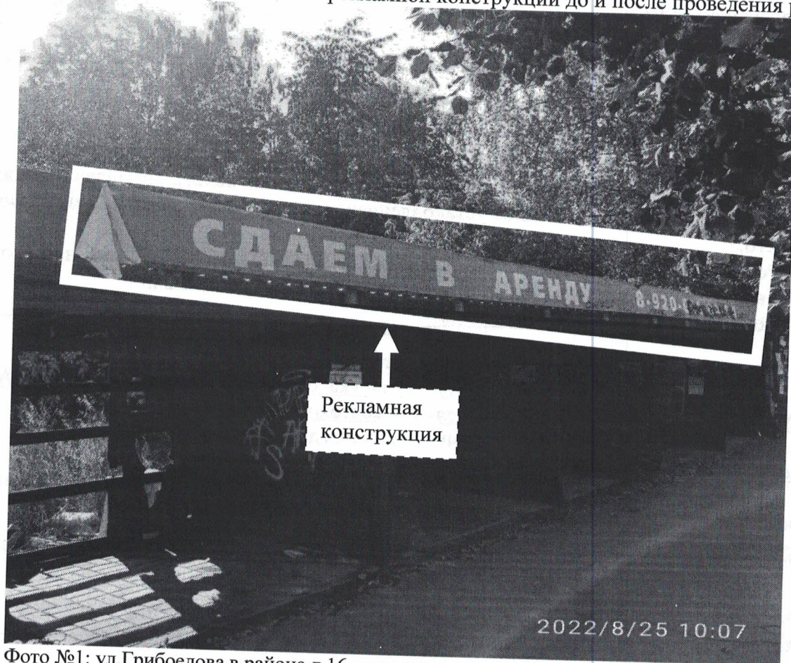
Фото №1: ул.Грибоедова в районе д.16 – до проведения работ по демонтажу.