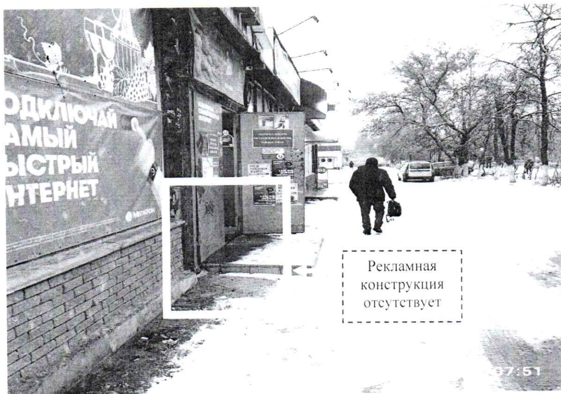
Фото № 2: пр. Чкалова, д. 52 – после проведения работ по демонтажу.