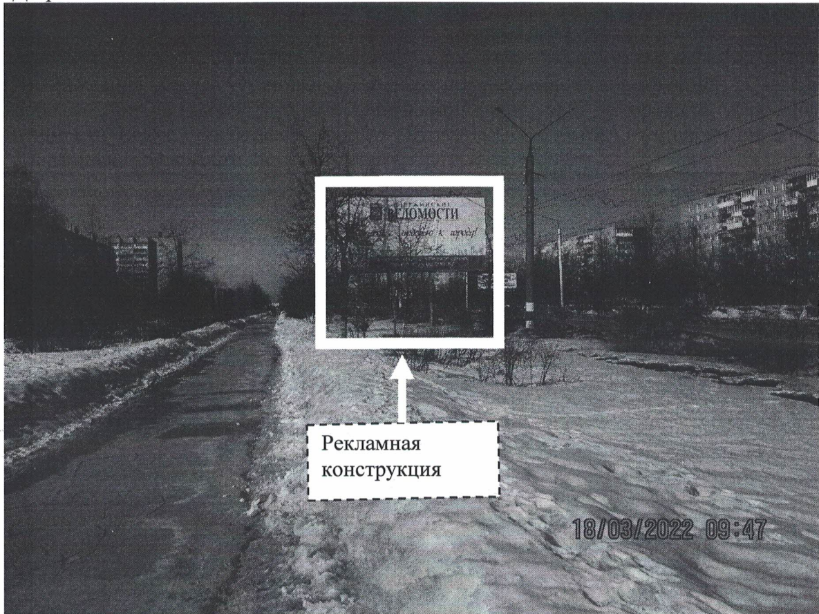
Фото № 1: Панорамное размещение рекламной конструкции.

Фотофиксация места установки (размещения) рекламной конструкции с эскизным изображением «Сторона А: Чистое информационное поле Сторона Б: Дзержинские Ведомости 15 лет с любовью к городу! Будь в курсе событий - установи приложение "Дзержинские ведомости"!»