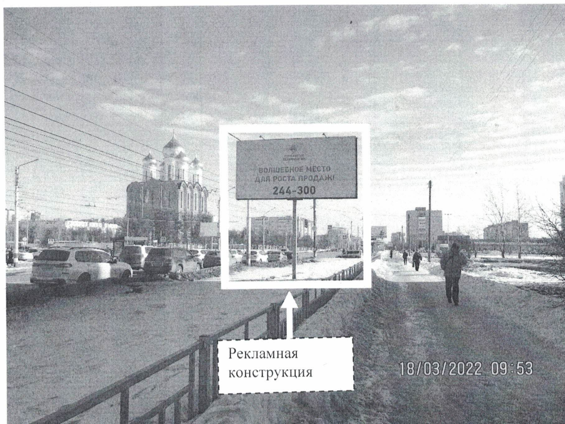
Фото № 1: Панорамное размещение рекламной конструкции.

Фотофиксация места установки (размещения) рекламной конструкции с эскизным изображением «Сторона А: Рекламные технологии Волшебное место для роста продаж 244-300 Сторона Б: Двери любых назначений Межкомнатные Входные Салон дверей СИМ СИМ Sim-simdveri.ru б-р Космонавтов 4б»