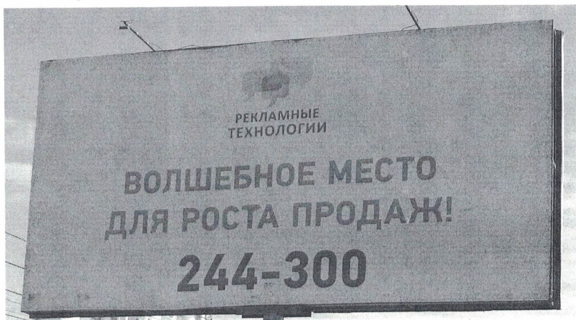
Фото № 2: Эскизное изображение рекламной конструкции, Сторона А.