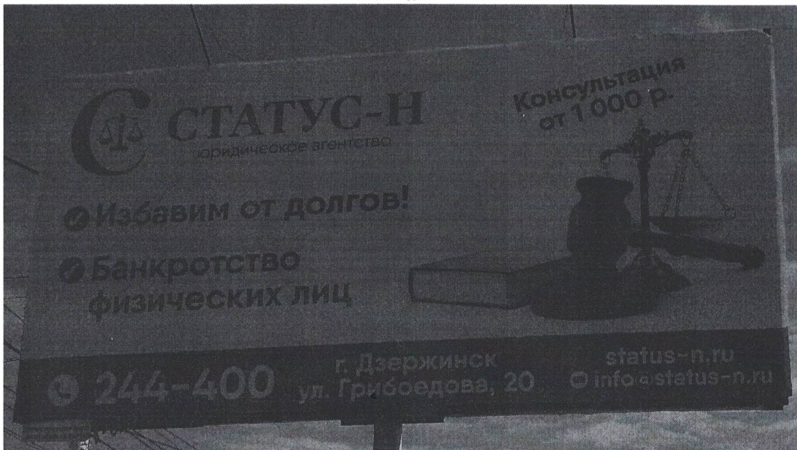
Фото № 2: Эскизное изображение рекламной конструкции, Сторона А.