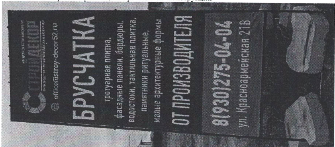
Фото № 2: Эскизное изображение рекламной конструкции