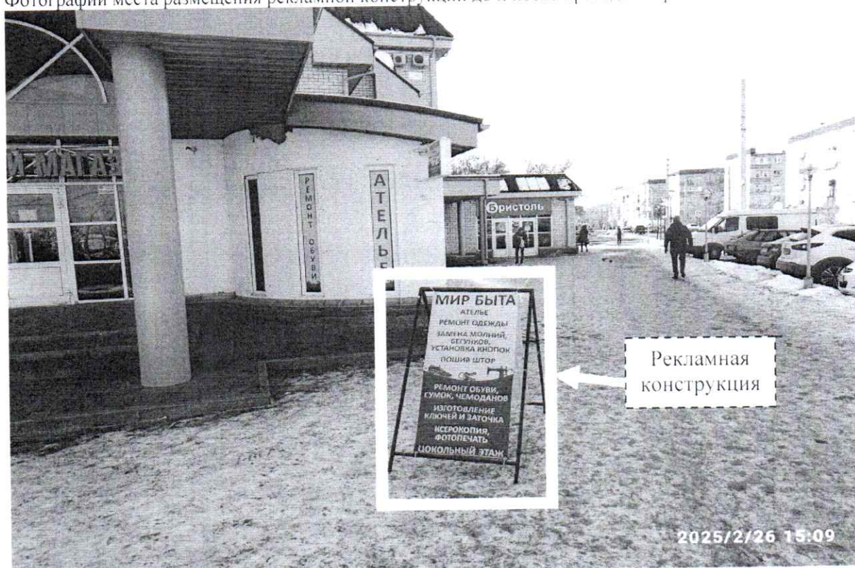
Фото № 1: ул. Привокзальная, 6 – до проведения работ по демонтажу.

Фотографии места размещения рекламной конструкции до и после проведения работ: