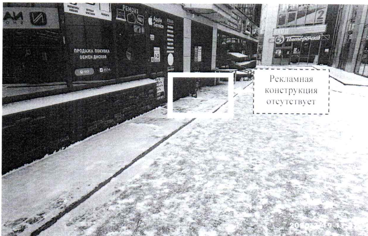
Фото № 2: ул. Гайдара, д. 59г – после проведения работ по демонтажу.