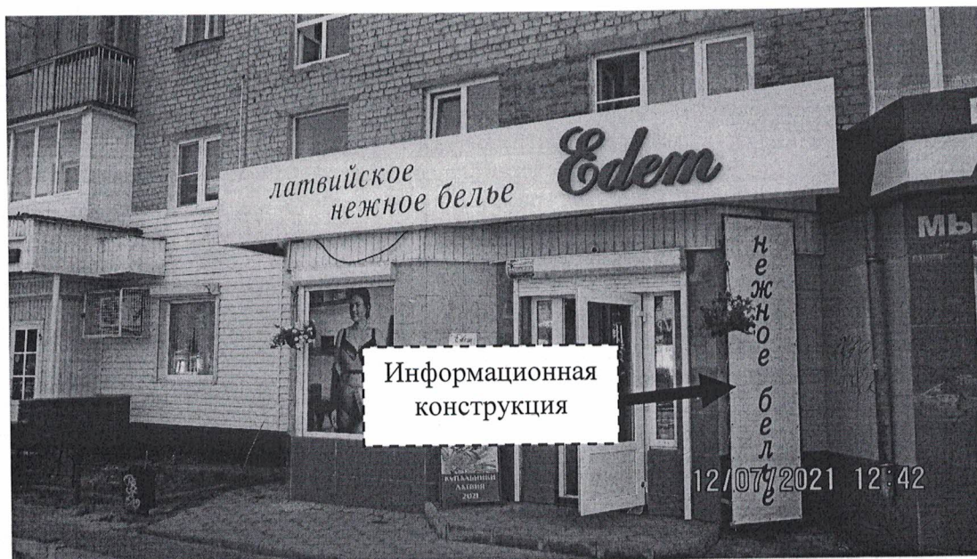
Схема установки информационной конструкции размером 1,0 х 3,0 м с надписью «Нежное белье», расположенной по адресу: г. Дзержинск, проспект Циолковского, д.19.

Фотофиксация информационной конструкции размером 1,0 х 3,0 м с надписью «Нежное белье», расположенной по адресу: г. Дзержинск, проспект Циолковского, д.19.