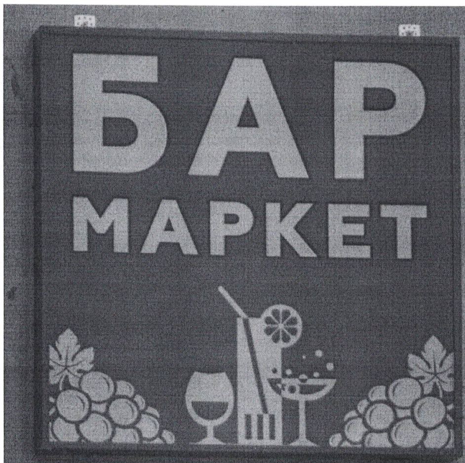
Фото 2: Эскизное изображение информационной конструкции.