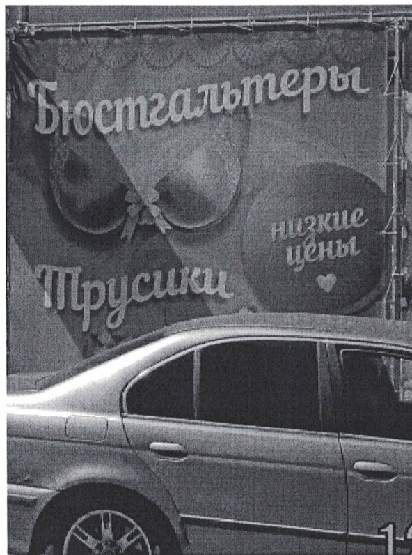
Фото 2: Эскизное изображение рекламной конструкции