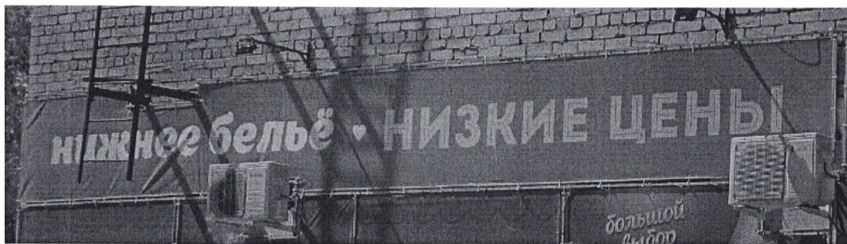
Фото 2: Эскизное изображение рекламной конструкции