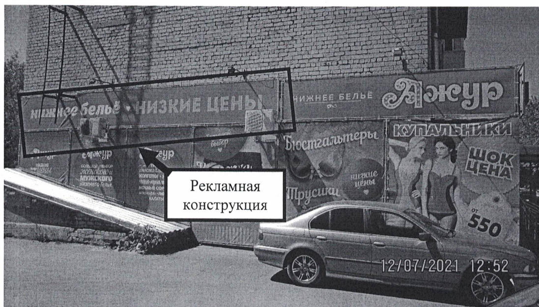
Фото 1: Панорамный вид размещения рекламной конструкции

Фотофиксация рекламной конструкции в виде навесного панно (баннера) с эскизным изображением «Нижнее белье. Низкие цены.», расположенной по адресу: Нижегородская обл., г. Дзержинск, пр. Ленина, д.30.