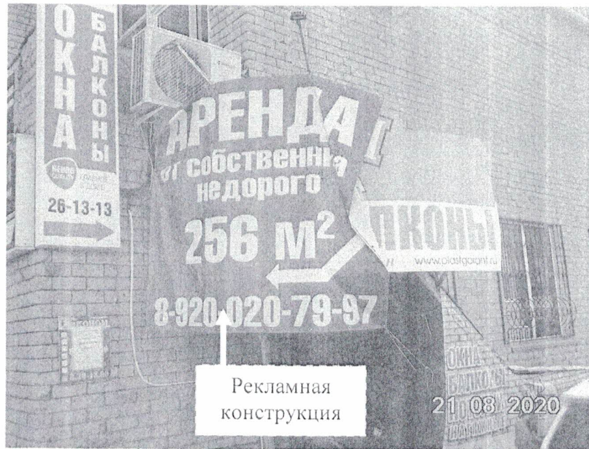
Фото № 1: Панорамный вид размещения рекламной конструкции.

Фотофиксация рекламной конструкции с эскизным изображением «Аренда от собственника недорого 256 м 2 тел. 8-920-020-79-97», расположенной по адресу: Нижегородская обл., г. Дзержинск, ул. Гайдара, д.59В.