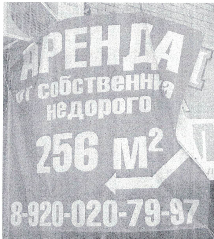
Фото №2: Эскизное изображение рекламной конструкции