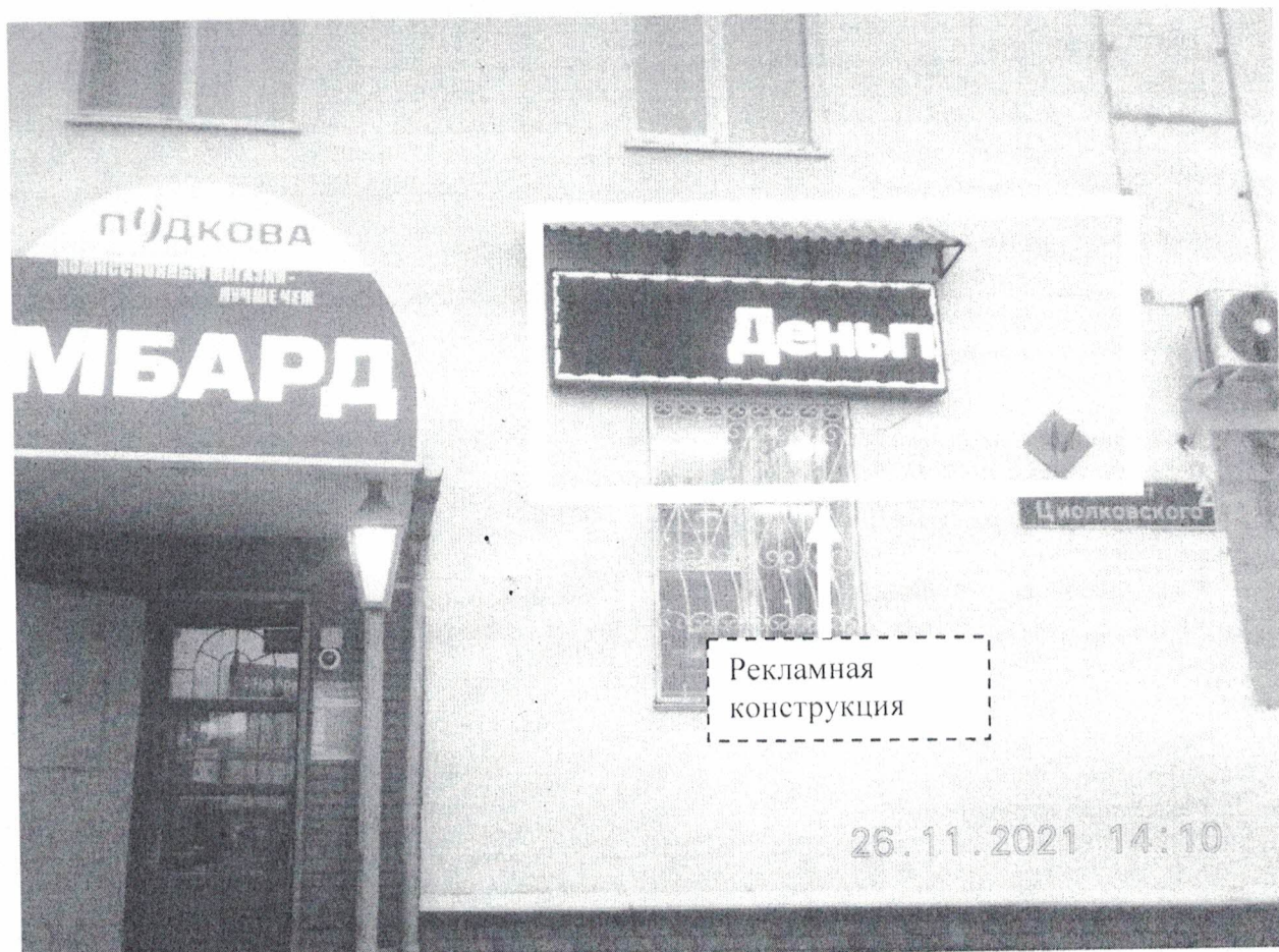
Фото № 1: Панорамный вид размещения рекламной конструкции

Фотофиксация рекламной конструкции с изменяющимся эскизным изображением – «Деньги...» по адресу: г.Дзержинск, пр-т Циолковского, д. 2.