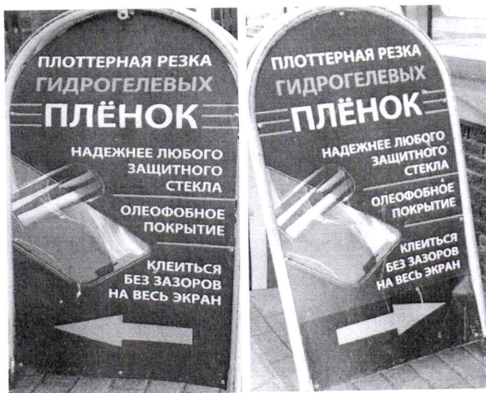
Фото № 2: Эскизное изображение рекламной конструкции (сторона А, сторона Б)