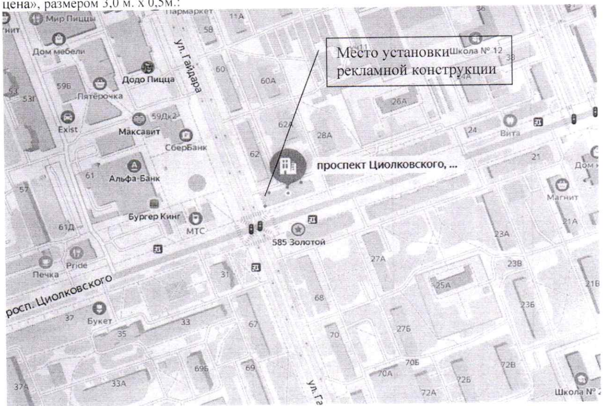
Схема установки (размещения) рекламной конструкции с эскизным изображением ««НЕПРОСПИ отличный товар оптовая цена ДОМАШНИЙ ТЕКСТИЛЬ НЕПРОСПИ отличный товар оптовая цена», размером 3,0 м. х 0,5м.: