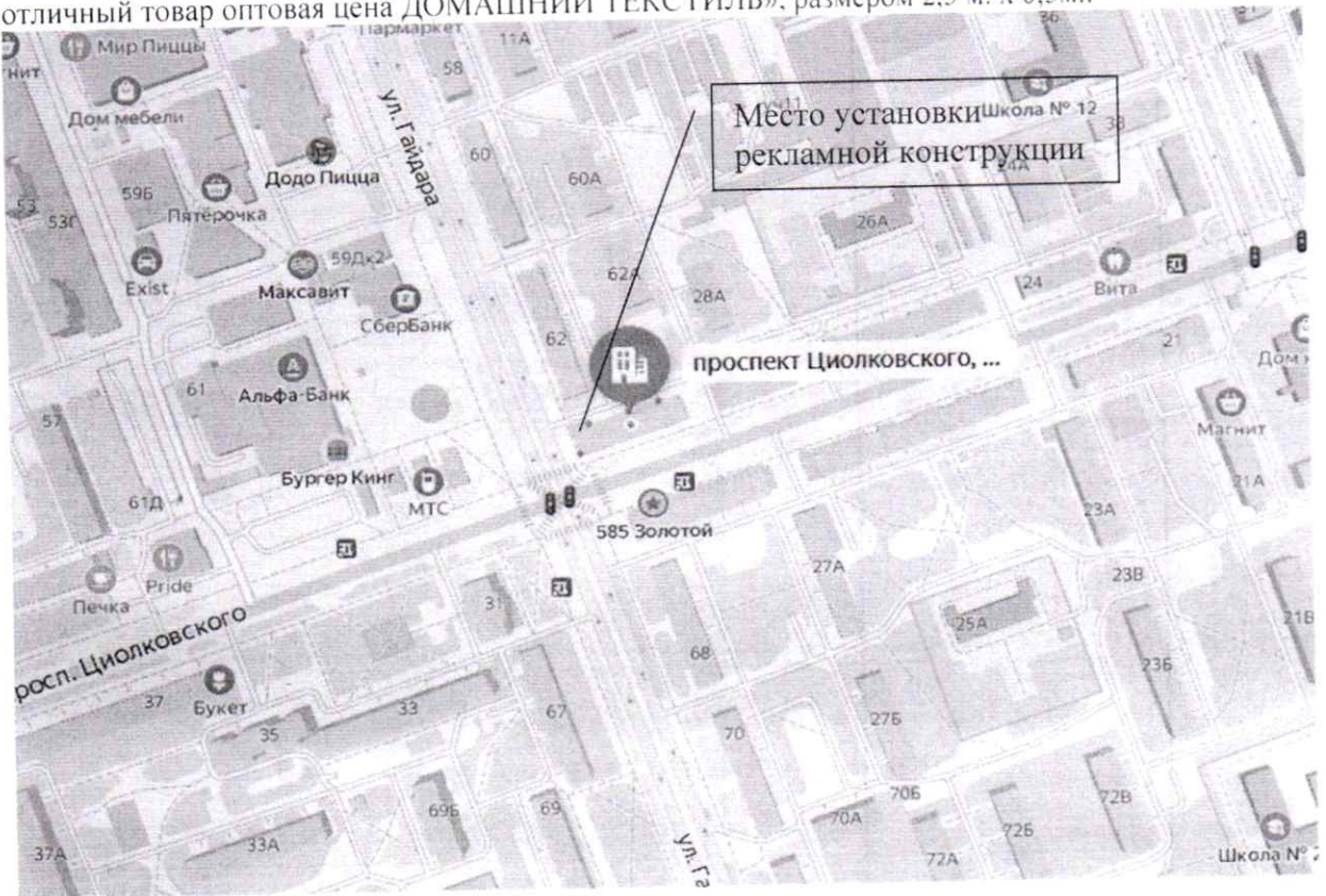
Схема установки (размещения) рекламной конструкции с эскизным изображением «НЕПРОСПИ отличный товар оптовая цена ДОМАШНИЙ ТЕКСТИЛЬ», размером 2.5 м. х 0.5м.: