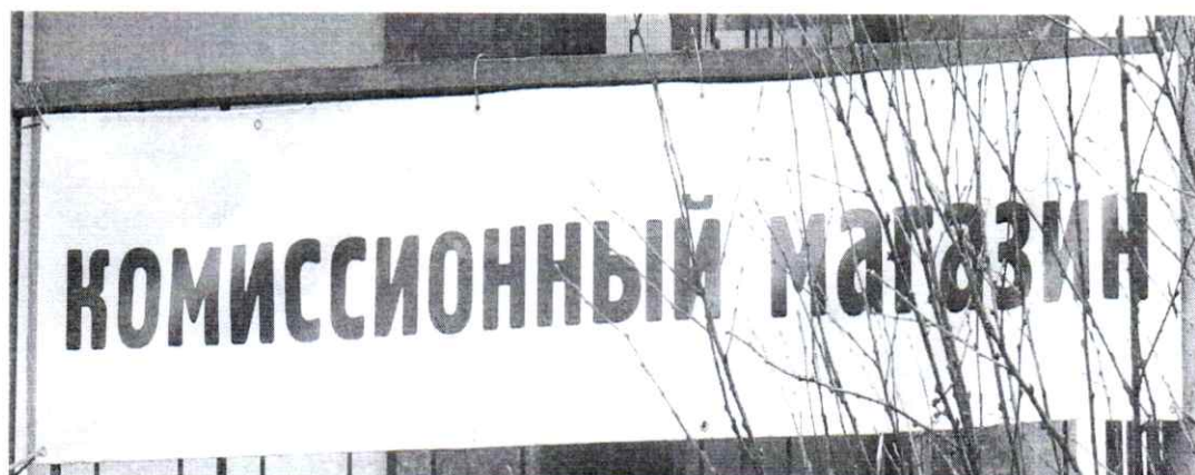
Фото № 2: Эскизное изображение рекламной конструкции