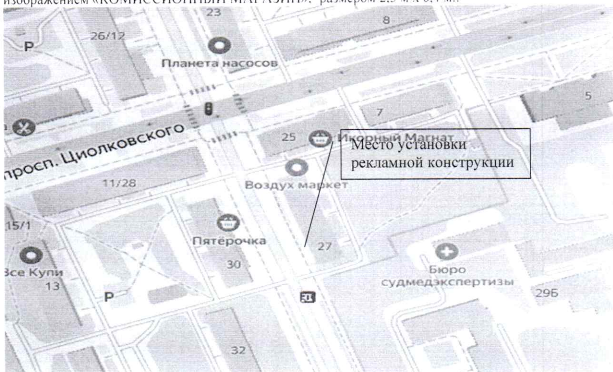
Схема установки (размещения) рекламной конструкции в виде баннерного полотна с эскизным изображением «КОМИССИОННЫЙ МАГАЗИН», размером 2,5 м x 0,4 м.: