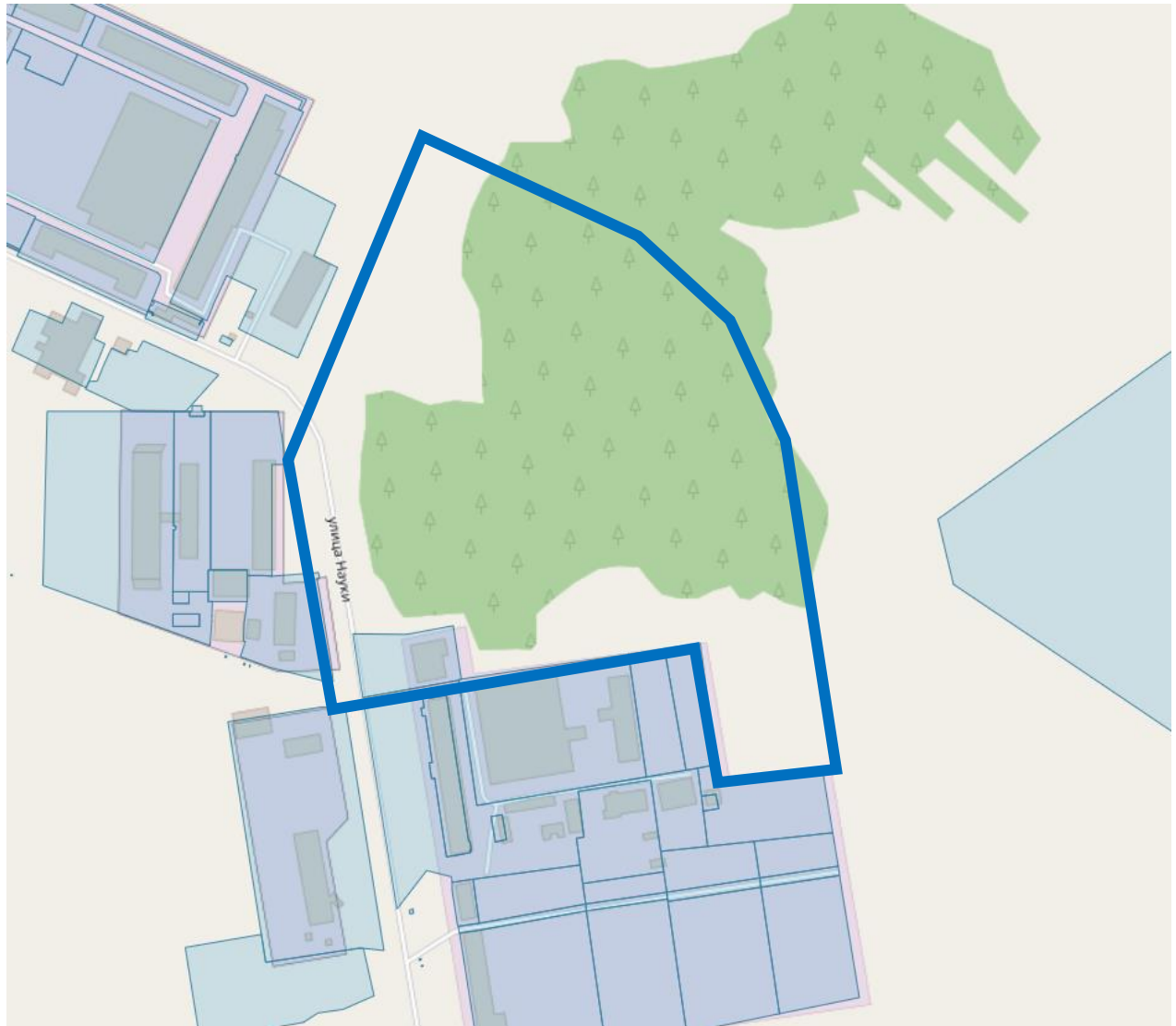
Схема границ подготовки документации по планировке территории