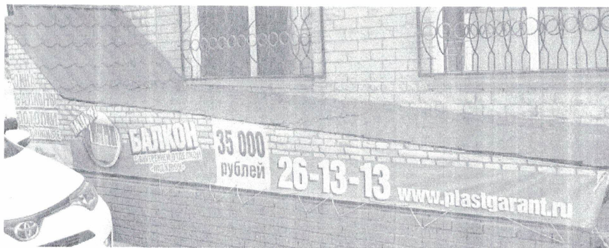
Фото №2: Эскизное изображение рекламной конструкции