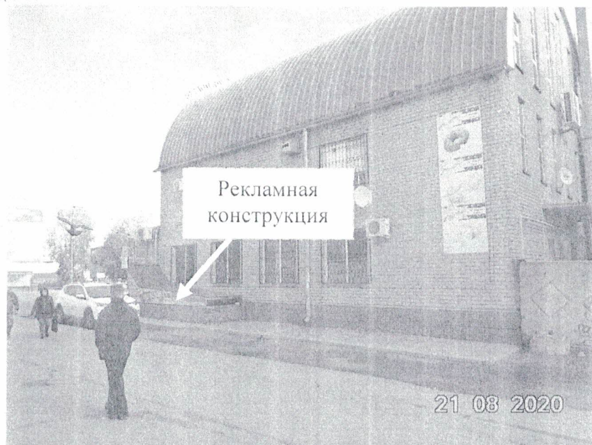
Фото № 1: Панорамный вид размещения рекламной конструкции.

Фотофиксация рекламной конструкции с эскизным изображением «Окна, балконы, потолки натяжные. Акция. Балконы с внутренней отделкой под ключ. 35 000 рублей 26-13-13 www.plastgarant.ru », расположенной по адресу: Нижегородская обл., г. Дзержинск, ул. Гайдара, д.59.