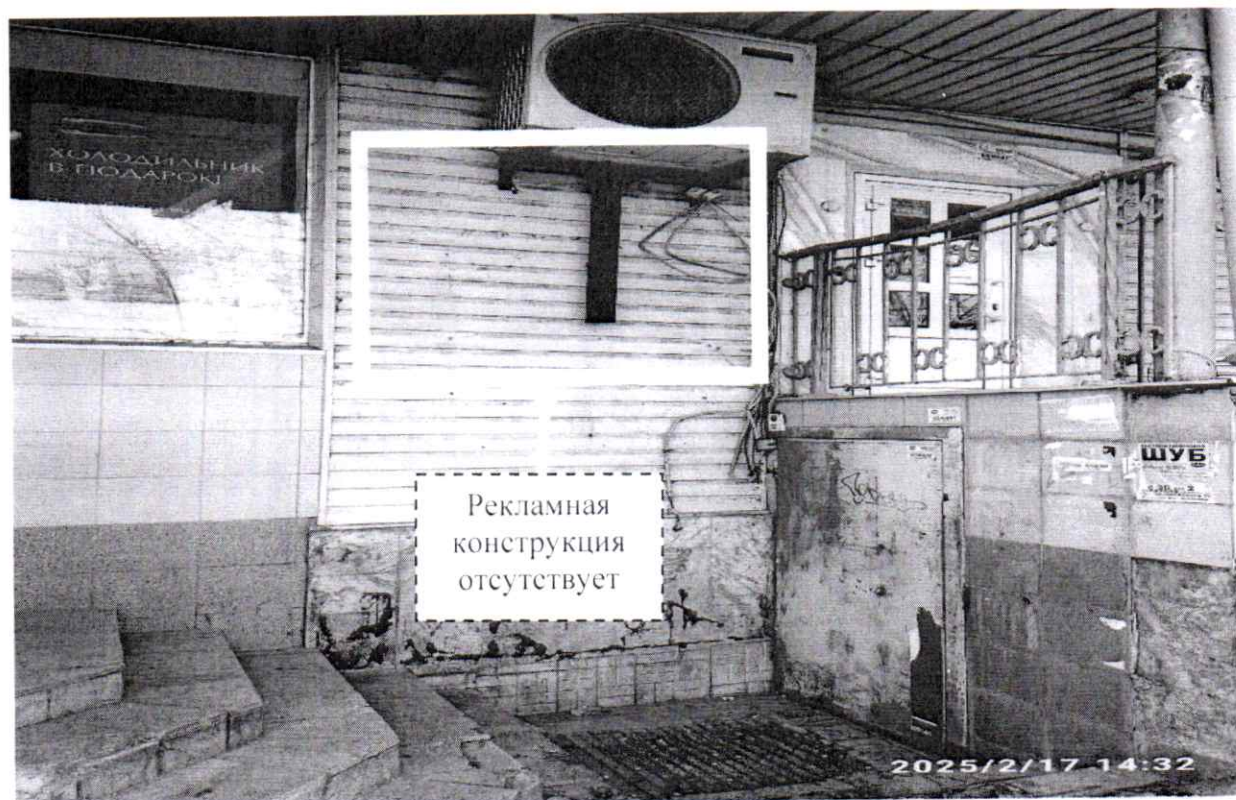
Фото № 2: пр. Ленина, д. 34/20 – после проведения работ по демонтажу.