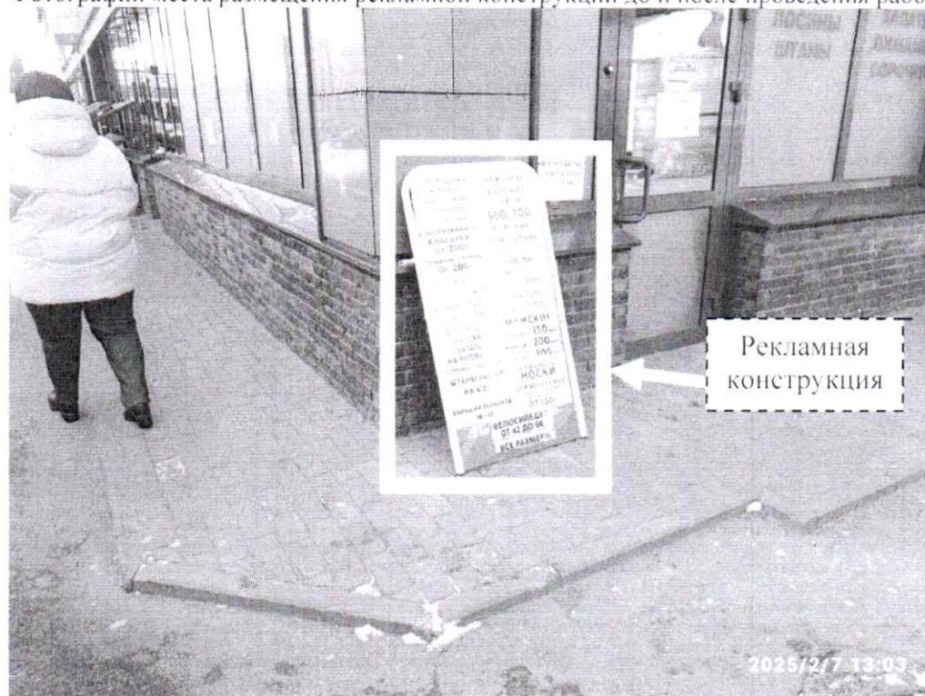
Фото № 1: ул. Гайдара, д. 59г – до проведения работ по демонтажу.

Фотографии места размещения рекламной конструкции до и после проведения работ: