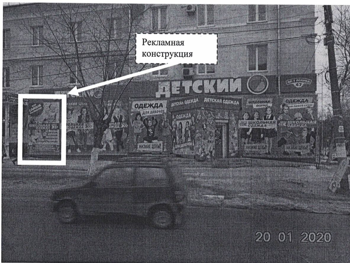
Фото № 1: Панорамный вид размещения рекламной конструкции

Фотофиксация рекламной конструкции с эскизным изображением «Для самых маленьких, здесь школьная одежда, белье, колготки, ползунки, комплекты, предметы ухода, конверты для прогулки, комбинезоны, трансформеры», расположенной по адресу: Нижегородская обл., г. Дзержинск, пр. Ленина, д.47.