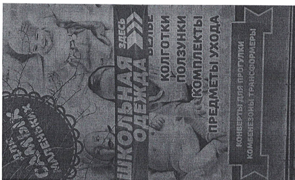
Фото № 2: Эскизное изображение рекламной конструкции