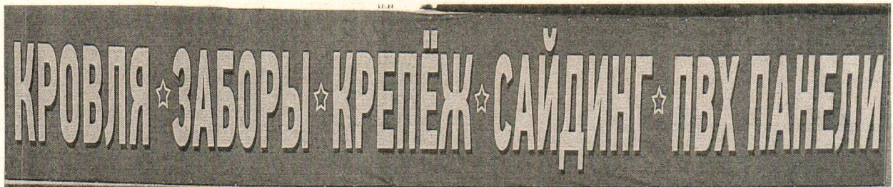
Фото №2: Эскизное изображение рекламной конструкции