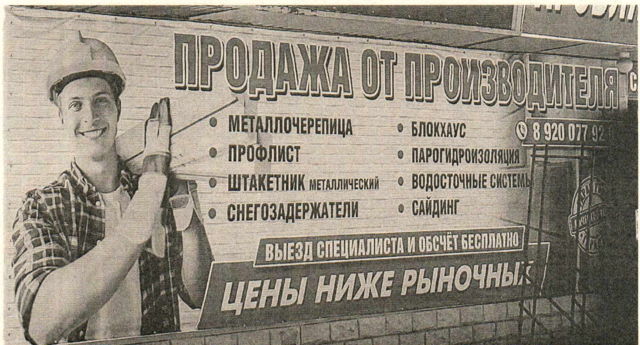
Фото №2: Эскизное изображение рекламной конструкции