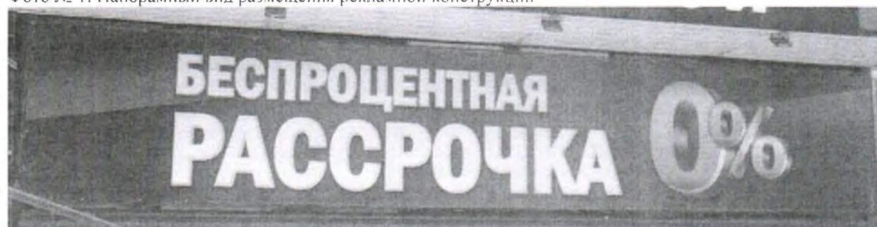
Фото № 2: Эскизное изображение размещения рекламной конструкции