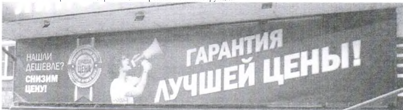
Фото № 2: Эскизное изображение размещения рекламной конструкции