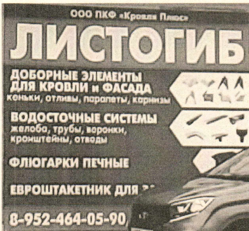
Фото №2: Эскизное изображение рекламной конструкции