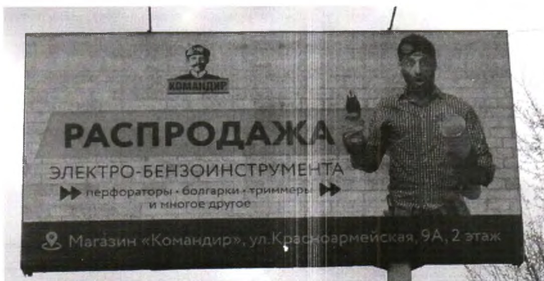
Фото № 2: Эскизное изображение рекламной конструкции, Сторона А.