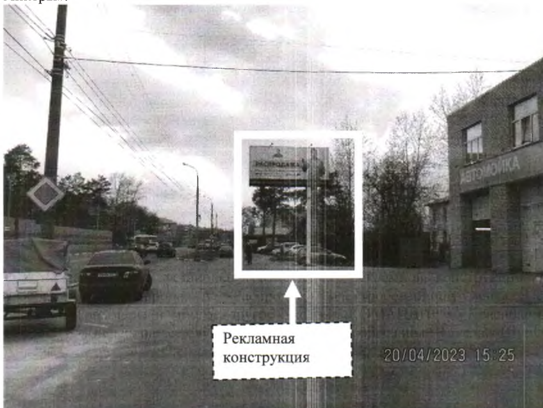
Фото № 1: Панорамное размещение рекламной конструкции, Сторона А.

Фотофиксация места установки (размещения) рекламной конструкции с эскизным изображением «Сторона А: Распродажа электробензоинструмента Перфораторы Болгарки Триммеры и многое другое Магазин КОМАНДИР ул.Красноармейская 9А. Сторона Б: Крепеж на все случаи жизни Авто и строительный Такелаж Шурупы Дюбели Анкеры».