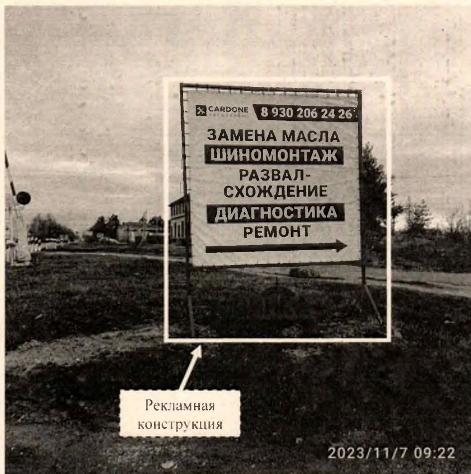
Фото № 1: Панорамный вид размещения рекламной конструкции (сторона А)

Фотофиксация рекламной конструкции размером 2,5 х 3,5 м с эскизным изображением «CARDONE автосервис 8 930 206 24 26 ЗАМЕНА МАСЛА ШИНОМОНТАЖ РАЗВАЛ-СХОЖДЕНИЕ ДИАГНОСТИКА РЕМОНТ», расположенной по адресу: г. Дзержинск, пр. Свердлова, в районе д. 64.