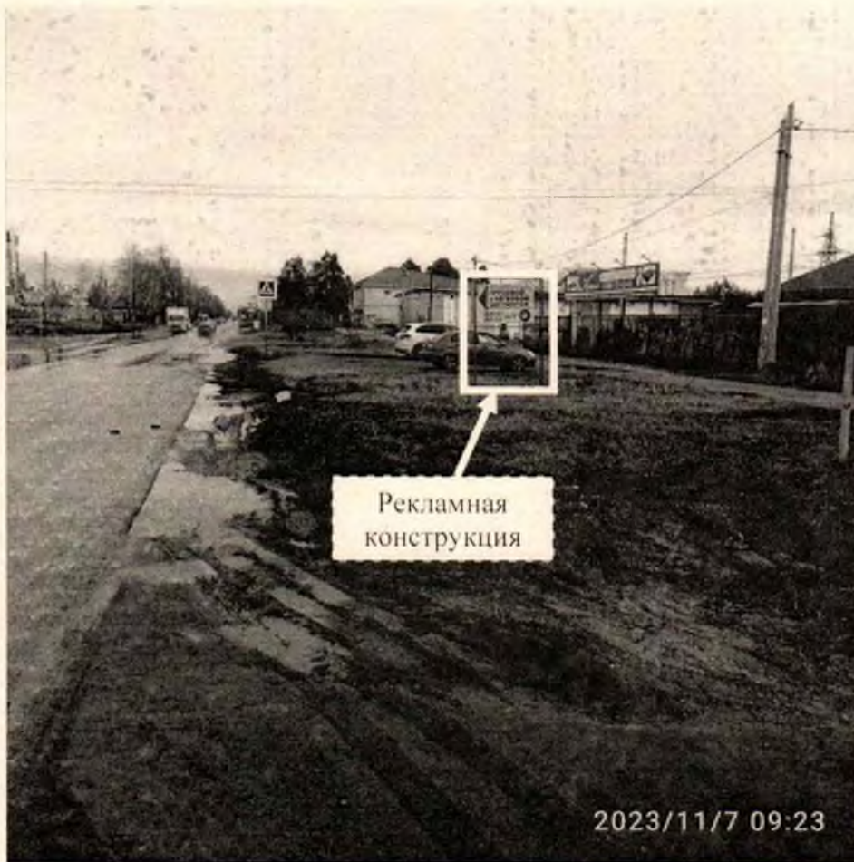
Фото № 1: Панорамный вид размещения рекламной конструкции (сторона А)

Фотофиксация рекламной конструкции размером 2,5 x 3,5 м с эскизным изображением «ГРУЗОВОЙ и ЛЕГКОВОЙ ШИНОМОНТАЖ ШИНЫ ДИСКИ Б/У», расположенной по адресу: г. Дзержинск, пр. Свердлова, в районе д. 62Д.