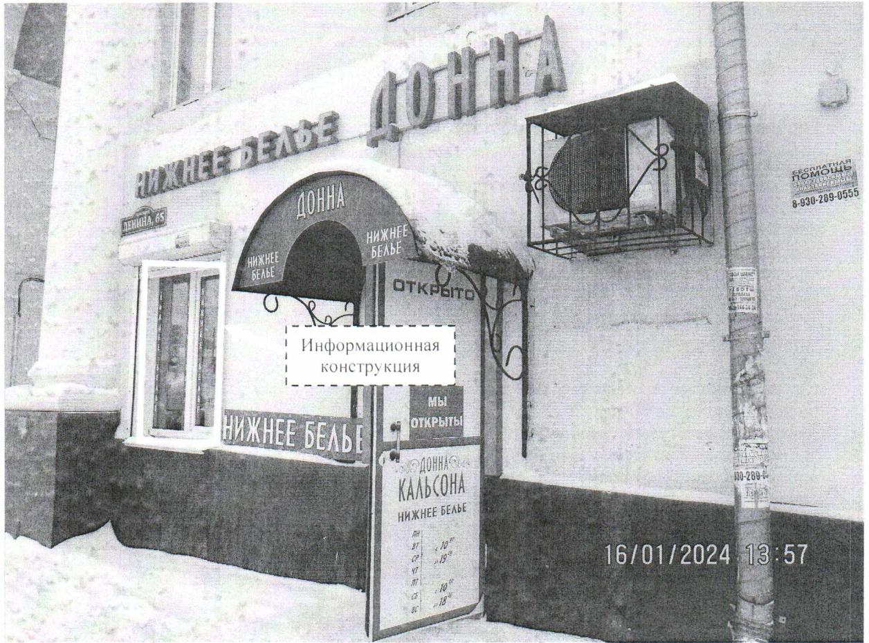
Фото № 1: Панорамный вид размещений информационной конструкции.

Фотофиксация информационной конструкции размером 1,0 x 1,5 м с эскизным изображением «НИЖНЕЕ БЕЛЬЕ ДОННА ДОННА НИЖНЕЕ БЕЛЬЕ ДОННА ДОННА», расположенной по адресу: г. Дзержинск, пр. Ленина, д. 65.