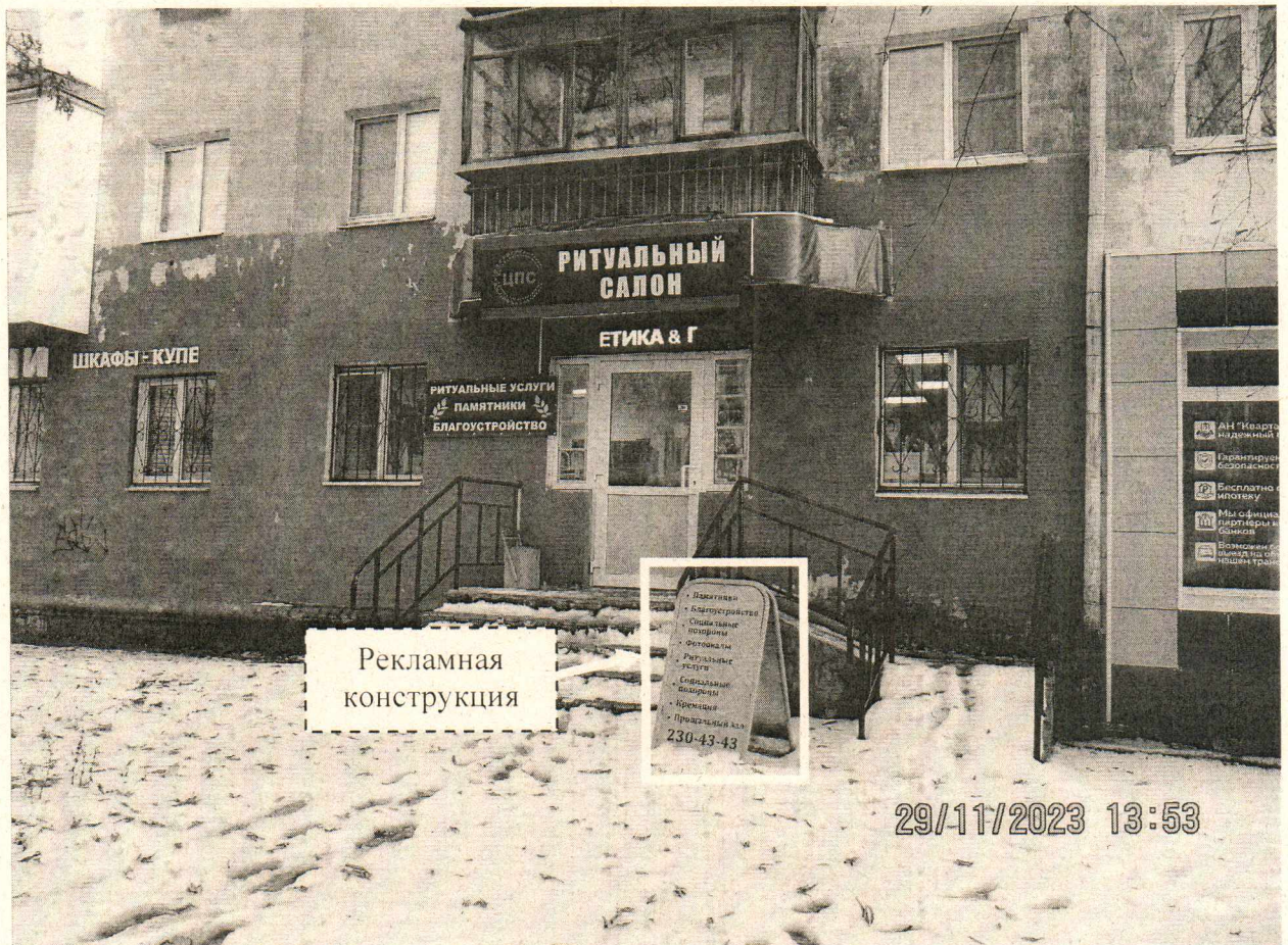
Фото № 1: Панорамный вид размещения рекламной конструкции (сторона А)

Фотофиксация рекламной конструкции размером 0,6 x 1,2 м с эскизным изображением «Памятники Благоустройство Социальные похороны Фотоовалы Ритуальные услуги Социальные похороны Кремация Прощальный зал 230-43-43», расположенной по адресу: г. Дзержинск, ул. Грибоедова, д. 3.