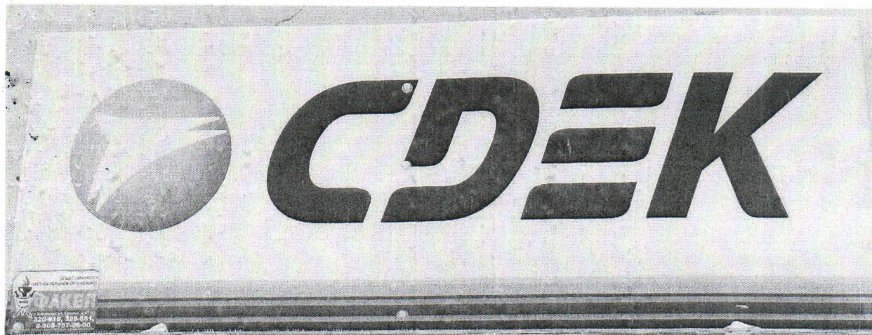
Фото № 2: Эскизное изображение информационной конструкции.