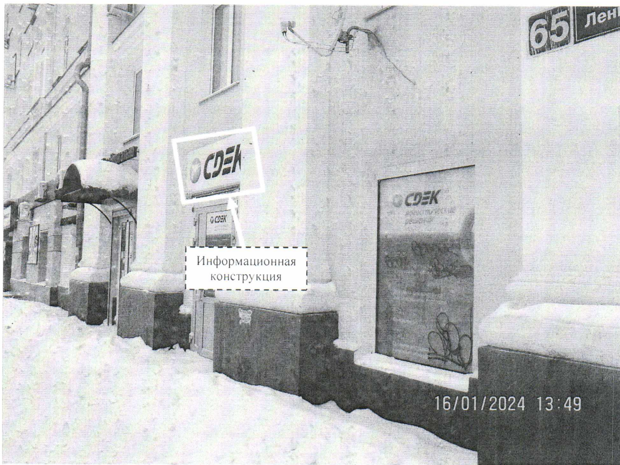
Фото № 1: Панорамный вид размещений информационной конструкции.

Фотофиксация информационной конструкции размером 2,0 х 1,0 м с эскизным изображением «СДЕК», расположенной по адресу: г. Дзержинск, пр. Ленина, д. 65.