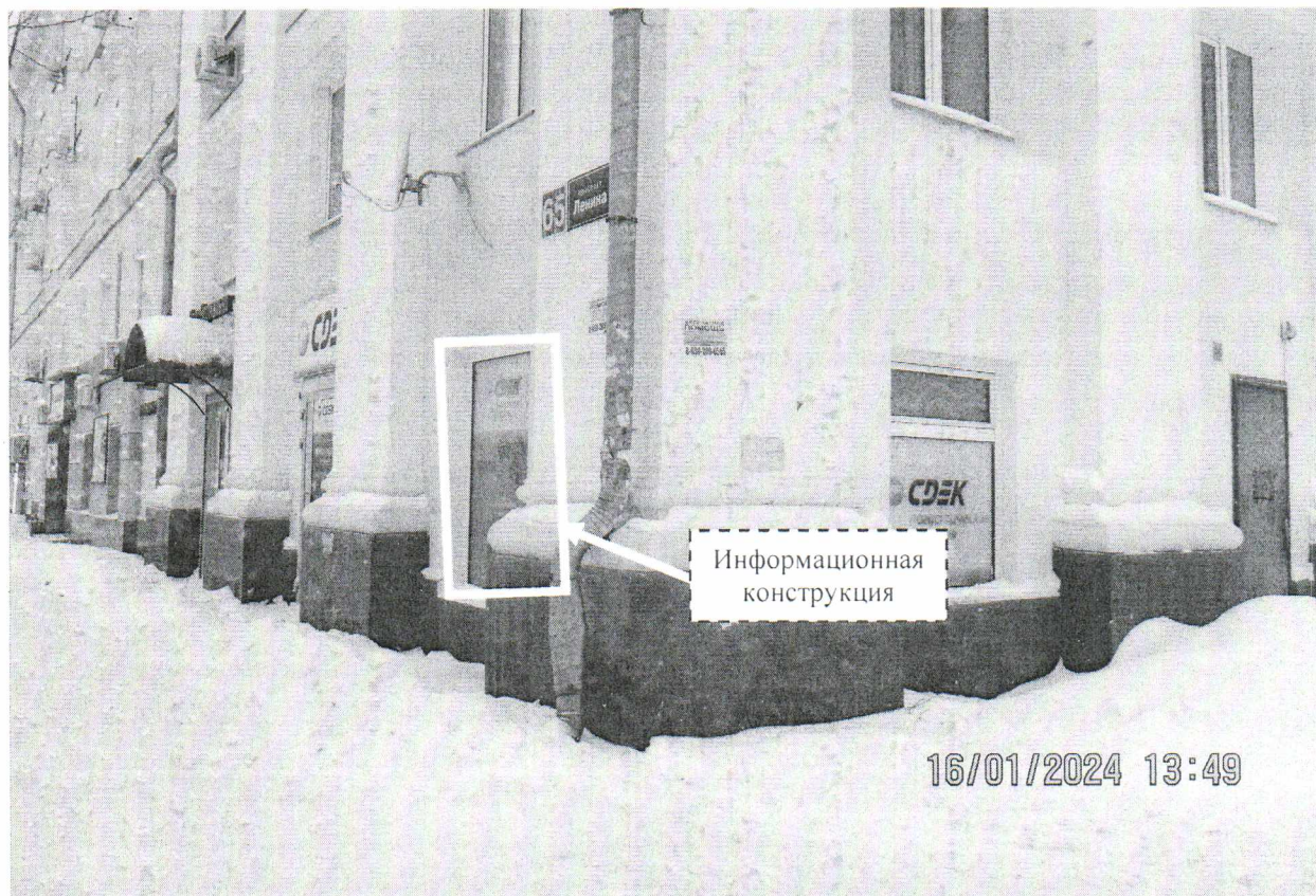
Фото № 1: Панорамный вид размещений информационной конструкции.

Фотофиксация информационной конструкции размером 1,0 х 2,0 м с эскизным изображением «СДЕК логистические решения Экспресс-доставка документов и грузов по России и миру Доставка для компаний дистанционной торговли Фулфилмент Срочная доставка к определенному числу», расположенной по адресу: г. Дзержинск, пр. Ленина, д. 65.